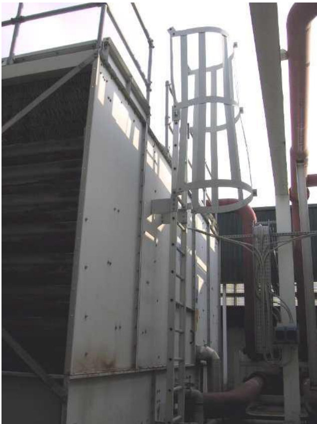
Scala fissa a pioli per l'accesso alla parte superiore delle torri evaporative.