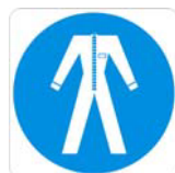
Protezione obbligatoria del corpo