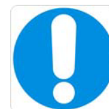
Obbligo generico (con eventuale cartello supplementare)