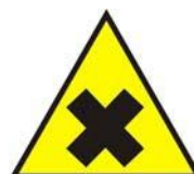
Sostanze nocive o irritanti