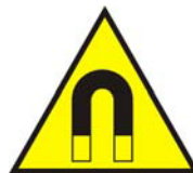
Campo magnetico intenso