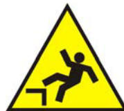
Caduta con dislivello