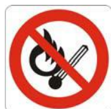
Vietato fumare o usare fiamme libere