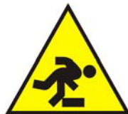
Pericolo di inciampo