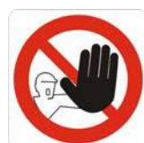
Divieto di accesso alle persone non autorizzate