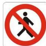
Vietato ai pedoni