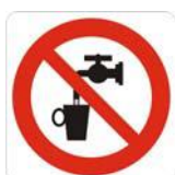
Acqua non potabile con acqua