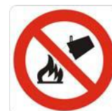
Divieto di spegnere con acqua