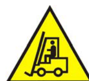
Carrelli di Movimentazione