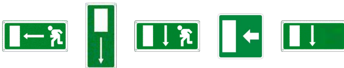
Percorso/Uscita di emergenza