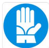
Guanti di protezione obbligatoria