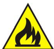
Materiale infiammabile o alta temperatura (1)

(1) In assenza di un controllo specifico per alta temperatura .