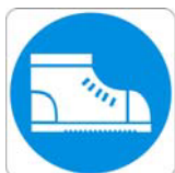
Calzature di sicurezza obbligatoria