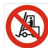
Vietato ai carrelli di movimentazione